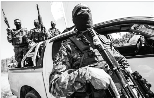
از سوی دیگری، یک رهبر حماس که با العربی

الجدید صحبت می‌کرد، اطلاعاتی درباره وضعیت میدانی و ارتباطات بین سطوح رهبری جنبش حماس در داخل غزه را فاش کرد و گفت: «وضعیت مقاومت مستحکم است و شکسته نشده است. کسی که در شرایط سخت قرار دارد، ارتش اشغالگر است که خلاف آن را تبلیغ می‌کند.»