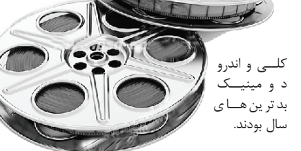
کلی و اندرو

این سازمان طنز که ضد جوایز مرسوم عمل می‌کند، سال ۱۹۸۱ توسط جان ویلسون و مو مورفی تأسیس شد. این تشکیلات سال‌ها پیش به دلیل نامزد کردن رایان کایرا آرمسترانگ، بازیگر ۱۲ ساله «فایراستارتر» به عنوان بدترین بازیگر زن، با واکنش‌های شدید مواجه شد و پس از غوغای آنلاین، نام وی را از میان نامزدها حذف کرد و جایزه بدترین بازیگر زن را به خود اختصاص داد. سال پیش تام هنکس، جرد لنوو، ماشین گان